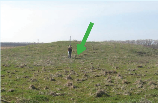
На этом месте грабители выкопали ямы