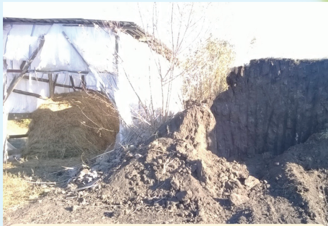
Сенник в кургане